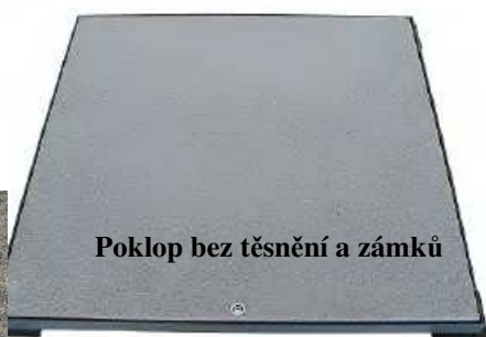
Poklop bez těsnění a zámků