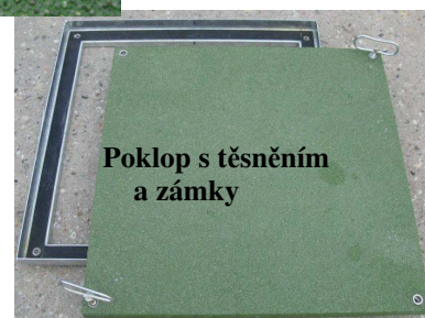
Poklop s těsněním a zámky